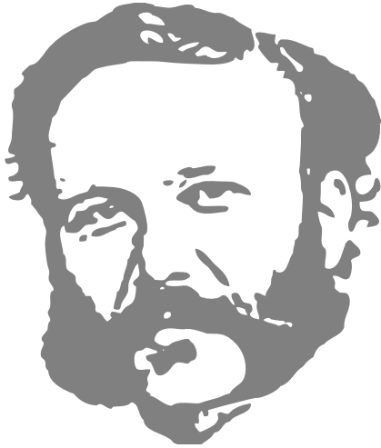
Henry Dunant (1828-1910), récipiendaire du premier prix Nobel de la paix en 1901, co-fondateur du Comité international de la Croix-Rouge (1863) et de la Croix-Rouge genevoise (1864)

Inclure la Croix-Rouge genevoise dans son testament est un geste précieux qui nous permet de poursuivre notre action sociale et humanitaire auprès des personnes vulnérables à Genève.