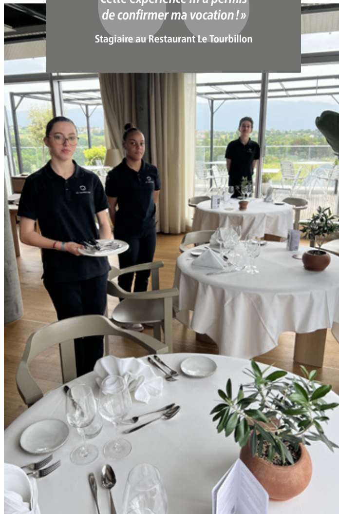
Stagiaires du Tourbillon, restaurant bistrannique dont la mission principale est l'intégration sociale et professionnelle.