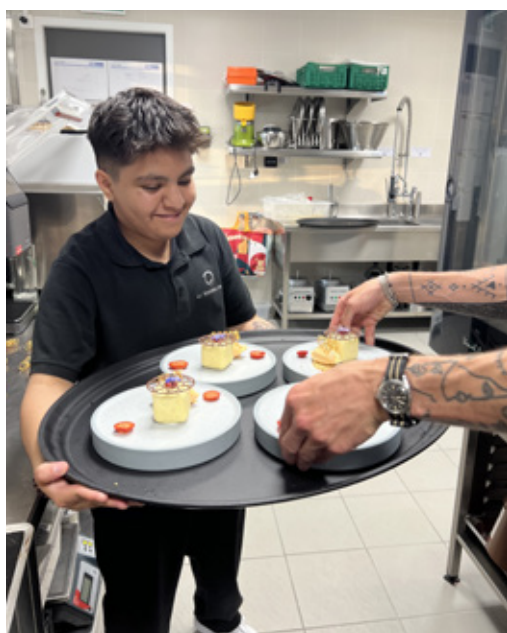
Un jeune en formation en charge du service du midi apporte «The Cube», un dessert à la vanille de Madagascar avec des fraises gariquettes et une tuile de cacao amer.

L'excellence du restaurant a été saluée tant au niveau local que national. Sa cheffe de cuisine s'est illustrée en accédant à la finale du prestigieux Concours «Le Cuisinier d'Or 2025», où elle a décroché la troisième place et remporté le Prix du public en février 2025. Parallèlement, Le Tourbillon a été distingué par le Prix Genève à Table, récompensant la finesse de sa cuisine locale et durable.