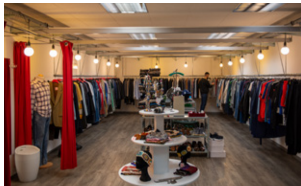
Le Vêt'Shop de la rue Leschot propose, sur deux étages, un large choix de vêtements de qualité pour adultes et enfants, à des prix très accessibles.

L'année a également été marquée par un fort engagement bénévole, avec 863 heures de bénévolat comptabilisées, soit une augmentation de 121 % par rapport à 2023. Ce soutien a permis de maintenir la qualité des prestations, en particulier dans les ateliers de valorisation. Le service a continué à s'appuyer sur des contrats de réinsertion, tout en enregistrant plusieurs retours à l'emploi durable.